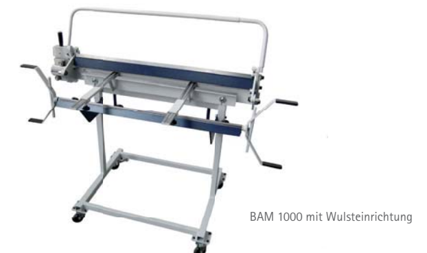
BAM 1000 mit Wulsteinrichtung